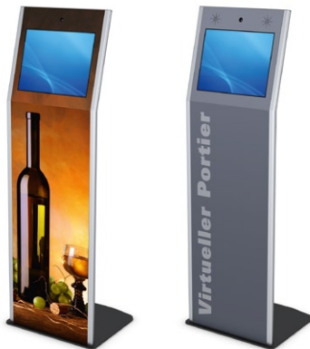
Individuelles Design durch Beklebung Individual design through the use of stick-on graphics

Within the scope of digital signage projects, the VANA model can be used as an interactive terminal complete with touch screen, keyboard, webcam, or various audio components. Further possible use are as a virtual porter, for providing tourist information, for occupational safety, as a POI or POS, for providing employee information, for time recording, and for multimedia presentations.