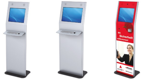
VANA 19" und 22" mit Edelstahl-Tastatur und mit Fingerabdrucksensor VANA 19" and 22" with stainless steel keyboard and with fingerprint sensor