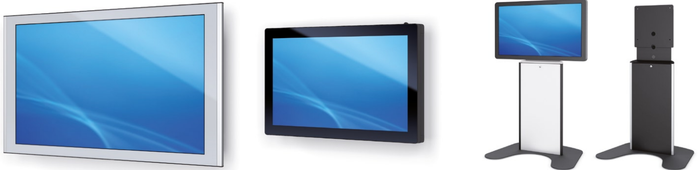
PHEX Wall 55", PHEX Wall 32" PCAP und Display auf Universal Standfuß mit PC-Integration PHEX Wall 55", PHEX Wall 32" PCAP and display on universal stand with PC integration

The PHEX Wall is technologically identical to the PHEX Stand. It was designed to be mounted to a wall or ceiling, and is available in both vertical and horizontal formats. The universal stand is suitable for free-standing of the PHEX wall displays and for existing displays from other manufacturers.