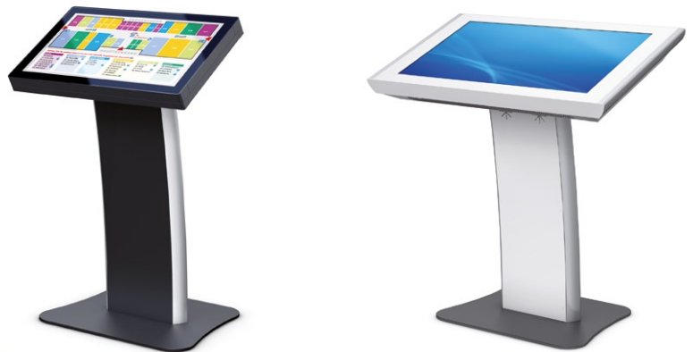
PHEX Console 32" PCAP (30° Display-Neigung) und 40" (20° Display-Neigung) PHEX Console 32" PCAP (30° display tilt) and 40" (20° display tilt)