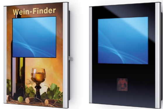
MITRA 15" mit individueller Beklebung und MITRA 19" mit Barcode-Lesegerät MITRA 15" with individual decal and MITRA 19" with a barcode reader