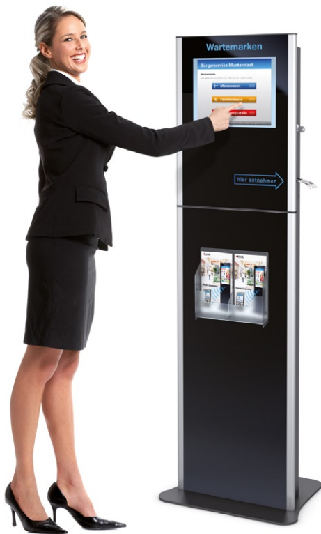
MITRA als Wartemarken-Terminal mit optionalem Standfuß MITRA receipt printer as a part of a waiting area management with optional stand