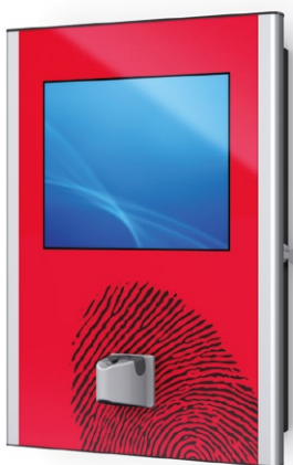
MITRA mit Fingerabdrucksensor und individueller Bedruckung MITRA with fingerprint sensor and individual printed front

The version with a receipt printer, card reader, etc. can be used as a ticket dispenser, for time recording, or for access control, for example.